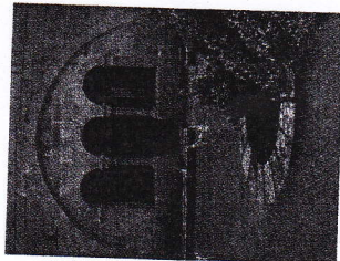
Croix de Comberoumal